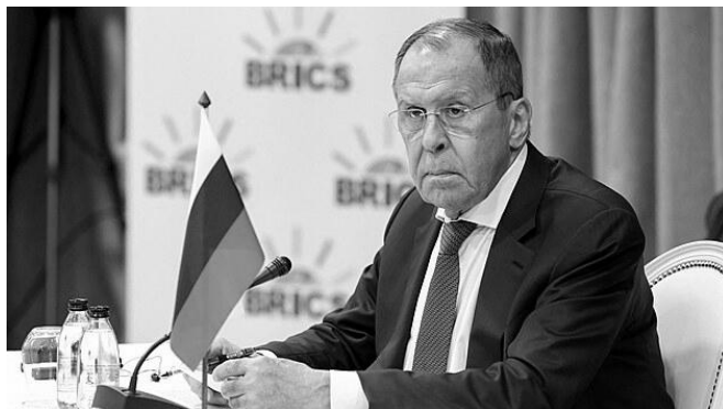
Úpadek ministra Lavrova. Jak kdysi titán diplomacie spěje k potupnému konci