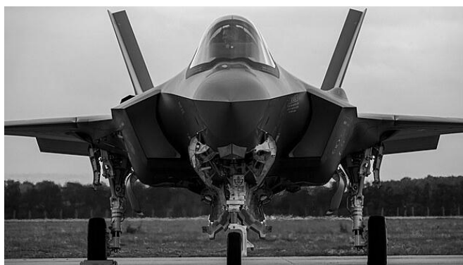
Americké F-35 budou stát 322 miliard. Náklady na provoz převýší kupní cenu